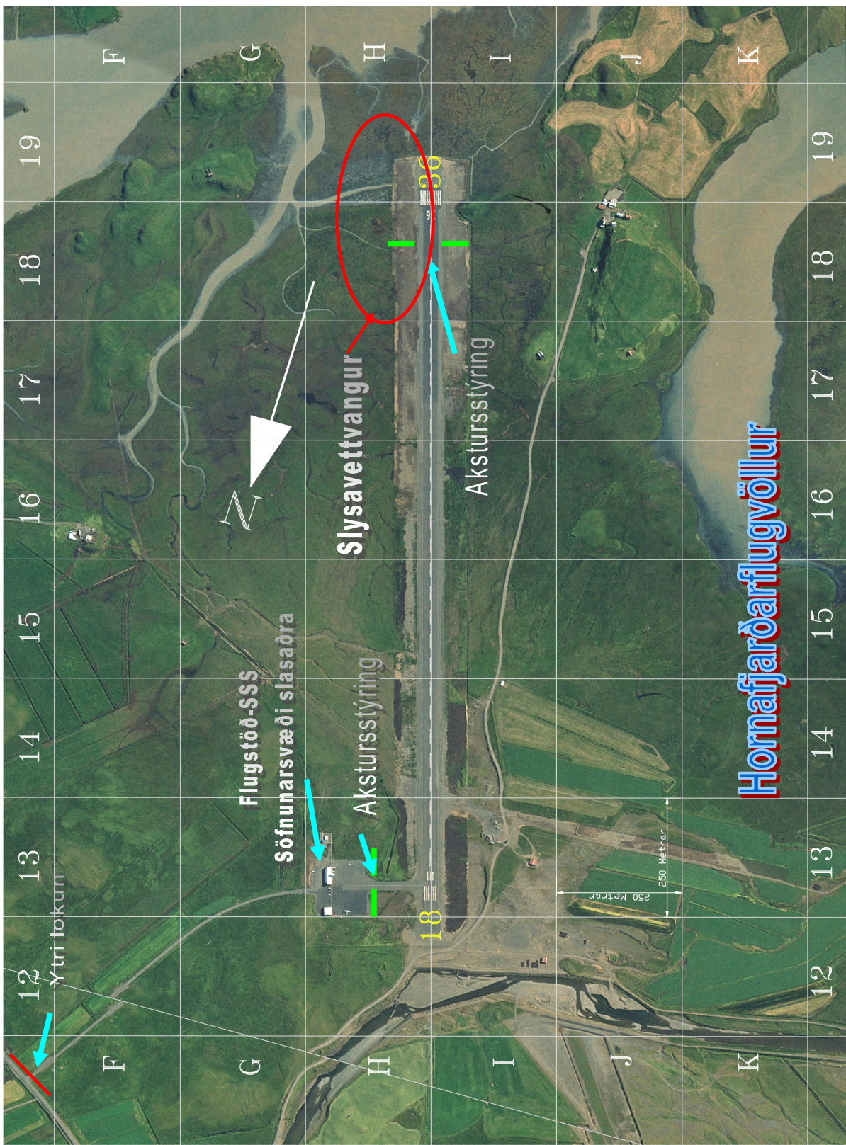
Hornafjarðarflugvöllur Kort 1