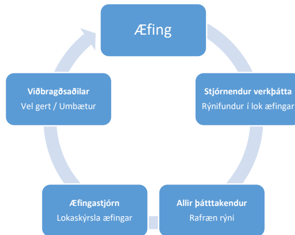
Mynd. Rýniferli æfinga.

Rýni er einn af mikilvægu þáttum í kjölfar æfinga. Rýnin er með tvennum hætti, annars vegar eru teknir rýnipunktur í kjölfar æfingar þar sem helstu verkþáttastjórar og ráðgjafar fara stuttlega yfir sína punkta. Í framhaldinu fá allir þátttakendur hlekk á rafræna rýni. Með þessum hætti koma fleiri að rýni æfingarinnar og fjölbreyttari sjónarmið koma fram. Rafræn rýni er tekin saman í lokaskýrslu æfingar og geta viðbragðsaðilar þá nýtt skýrsluna til eflingar styrkleika eða umbóta þar sem við á.