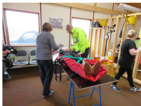
Þolandi skoðaður á söfnunarsvæði slasaðra í flugstöð.