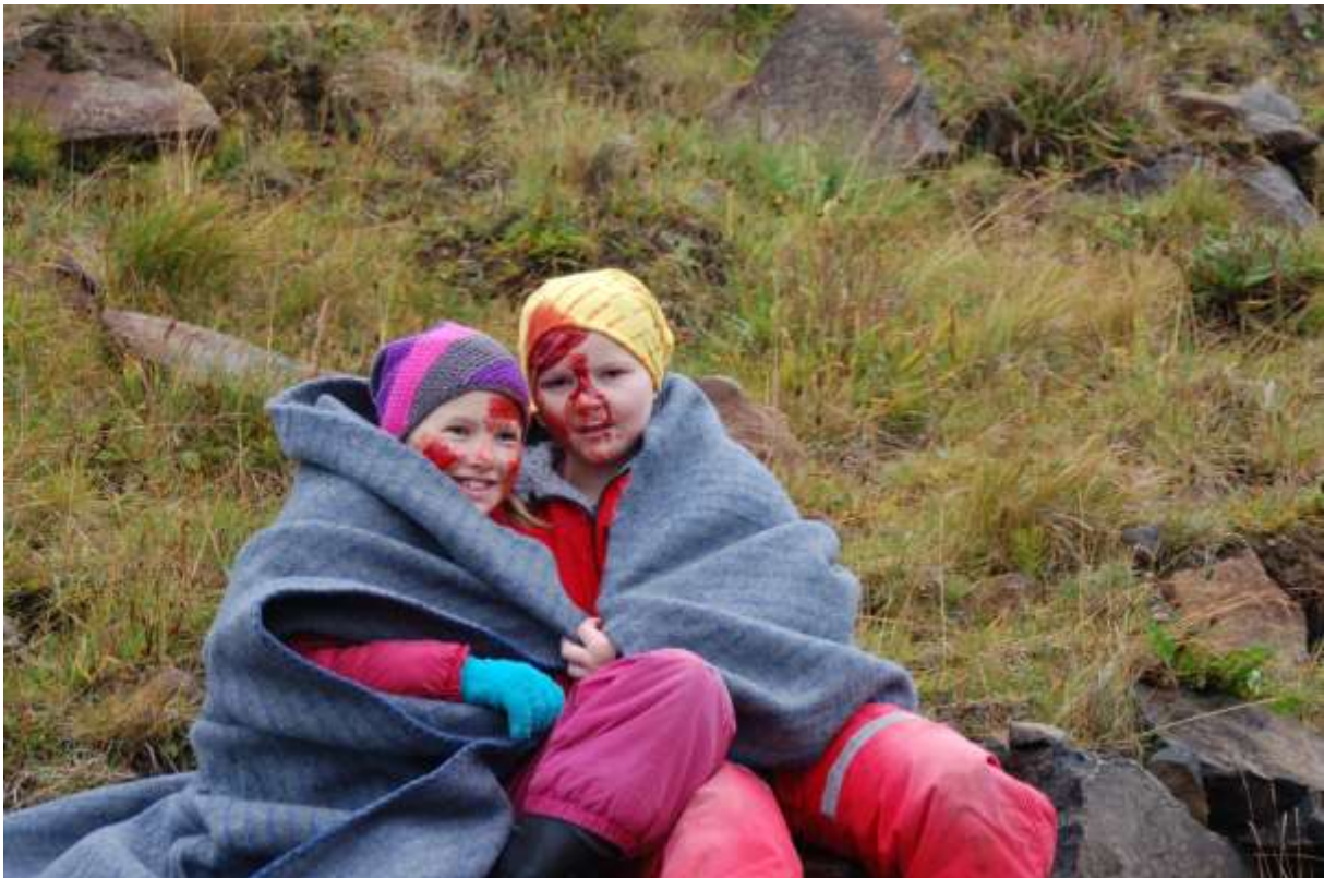
Mynd 7. Sjúklingar.