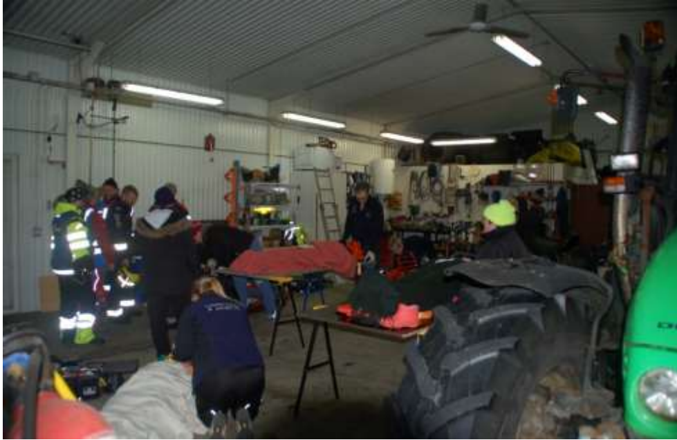
Mynd 10. SSS.