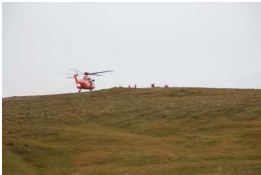
Mynd 8. Þyrla Landhelgisgæsluna.

Fyrir hönd SAK þakka ég kærleg fyrir skemmtilegan og lærdómsríkan dag.