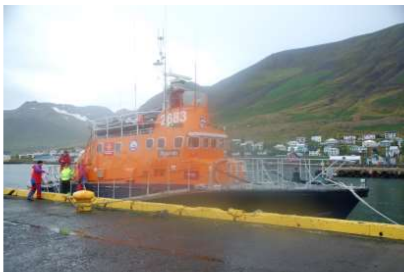
Mynd 6. Björgunarskipið Sigurvin.