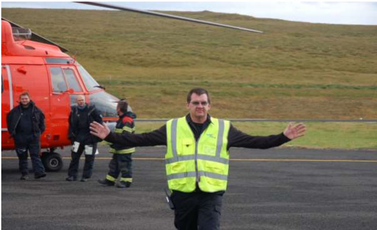
Mynd 11. Æfingin búinn.