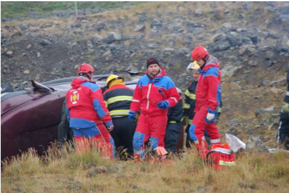
Mynd 2. Björgunarstörf.

Mikil vinna liggur að baki hvernar flugslysaæfingar. Undirbúningur hefst venjulega nokkrum mánuðum fyrir æfinguna til að hún skili sem bestum árangri. Strax í janúar 2015 var byrjað að lesa yfir Flugslysaáætlunina fyrir Grímseyjarvöll og hún endurskoðuð og fólst þó nokkuð mikil vinna í því. Æfingastjórn fundaði nokkrum sinnum til að undirbúa æfinguna og einnig voru haldnir tveir fundir með þeim viðbragðseiningum sem koma áttu að æfingunni. Þeir sem voru boðaði á þá fundi voru Slysavarnarfélagið Landsbjörg (Svæðisstjórn) , Lögreglan á Norðurlandi eystra , Sjúkrahúsið á Akureyri og Slökkvilið Akureyrar . Eftir á að hyggja hefði líka verið gott að boða Norlandair og Heilbrigðisstofnun Norðurlands eystra á þá fundi. Æfingastjórn tekur það á sig að hafa ekki boðað þessa tvo aðila á fund.