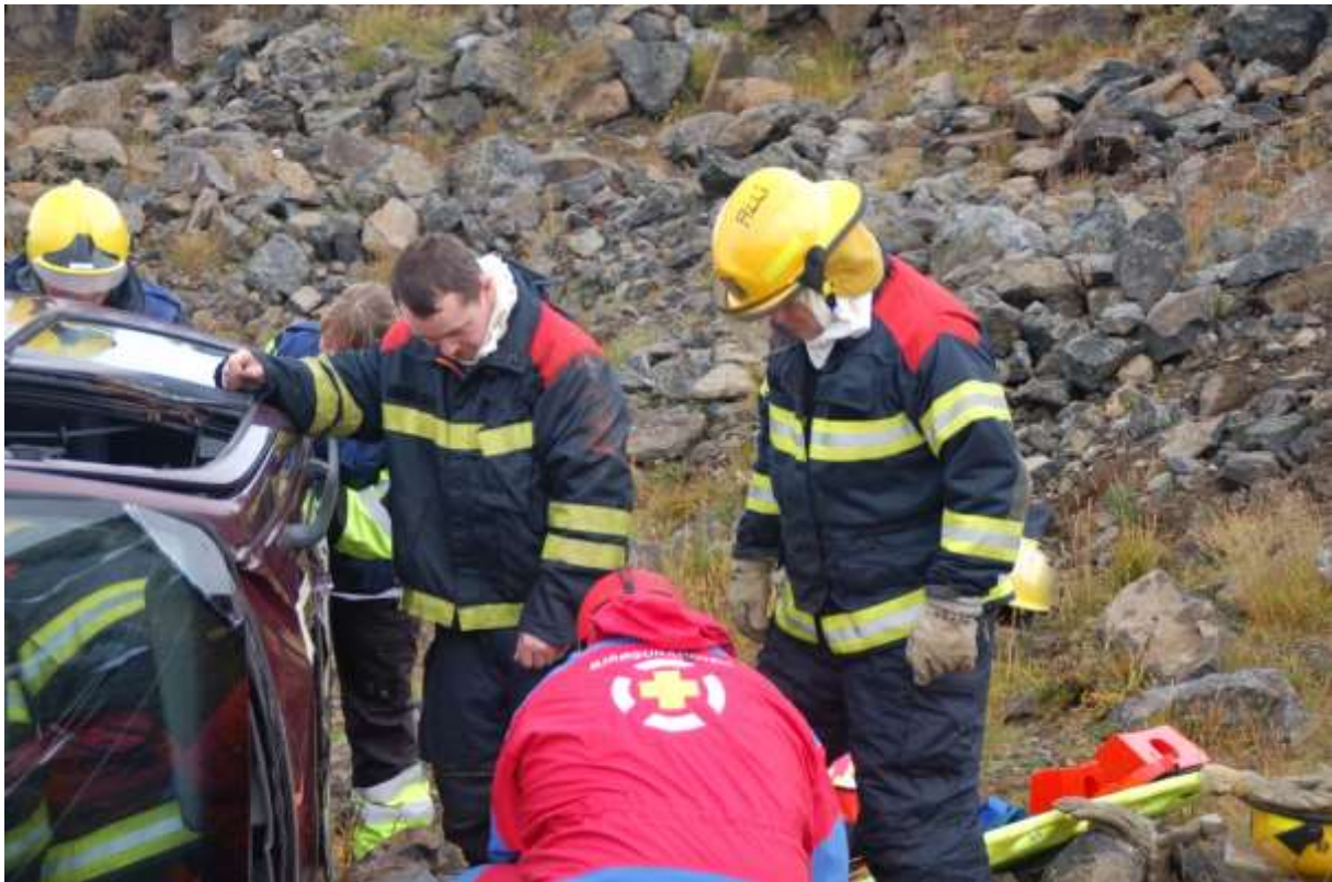
Mynd 1. Björgunarstörf.

Að viðbragðseiningar læri sem mest af æfingunni með því að sjá hvað miður fór í þeirra starfi á vettvangi og geti bætt sig á þeim sviðum og verið betur undirbúna fyrir útköll. Eins að hver eining geti séð lærdómspunkta hinna viðbragðseininganna og sjá þá hvort um sameiginlegt vandamál sé að ræða sem bæta mætti úr.