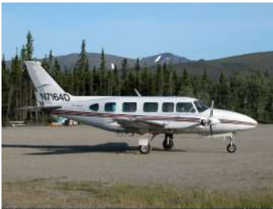
Mynd 3. Piper Chieftain (PA-31-350)

Slysavettvangurinn var hefðbundinn. Eitt bílflak sem farþegar voru festir í og eldvettvangur var gerður úr nokkrum vörubrettum. Polendum var dreift á jörðina nærri flakinu og einstaka hafður lengra frá aðal slysstaðnum.