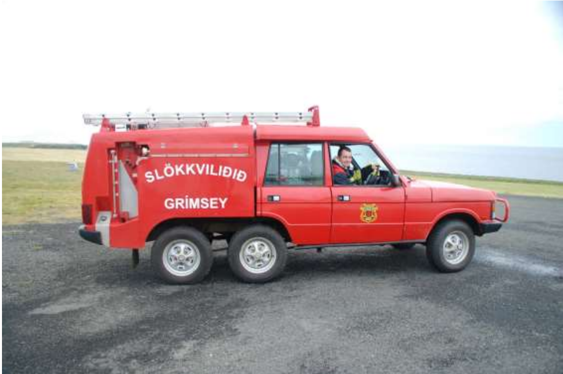
Mynd 5. Slökkvilið SA.

110°, 10 kt, engin úrkoma, OVC 5000 fet, 8°hiti, daggarmark 7°, loftþrýstingur 1010 hp.